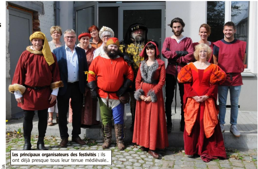
Les principaux organisateurs des festivités : ils ont déjà presque tous leur tenue médiévale...