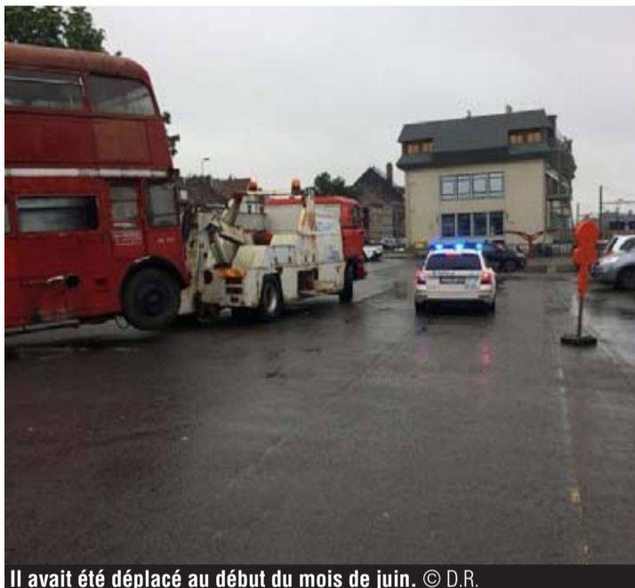
Il avait été déplacé au début du mois de juin.