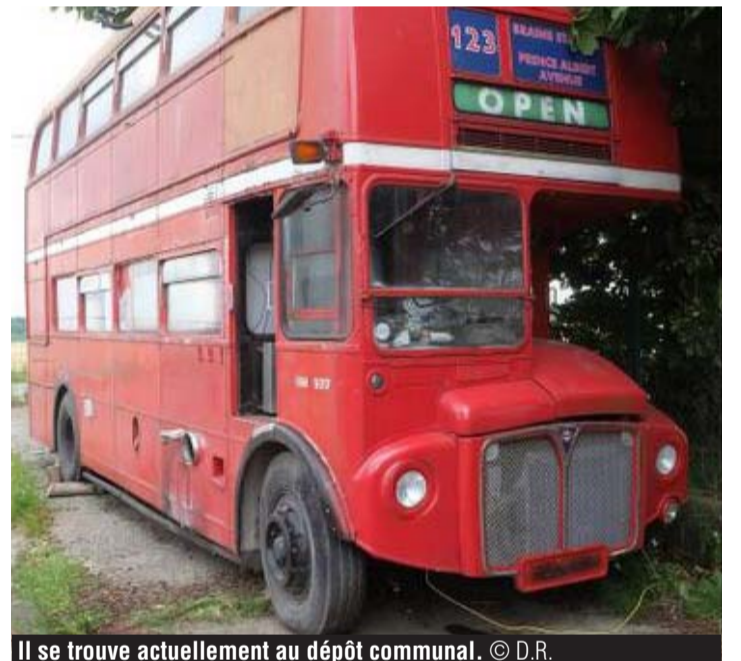
Il se trouve actuellement au dépôt communal.