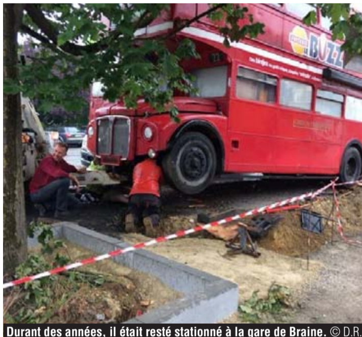
Durant des années, il était resté stationné à la gare de Braine.