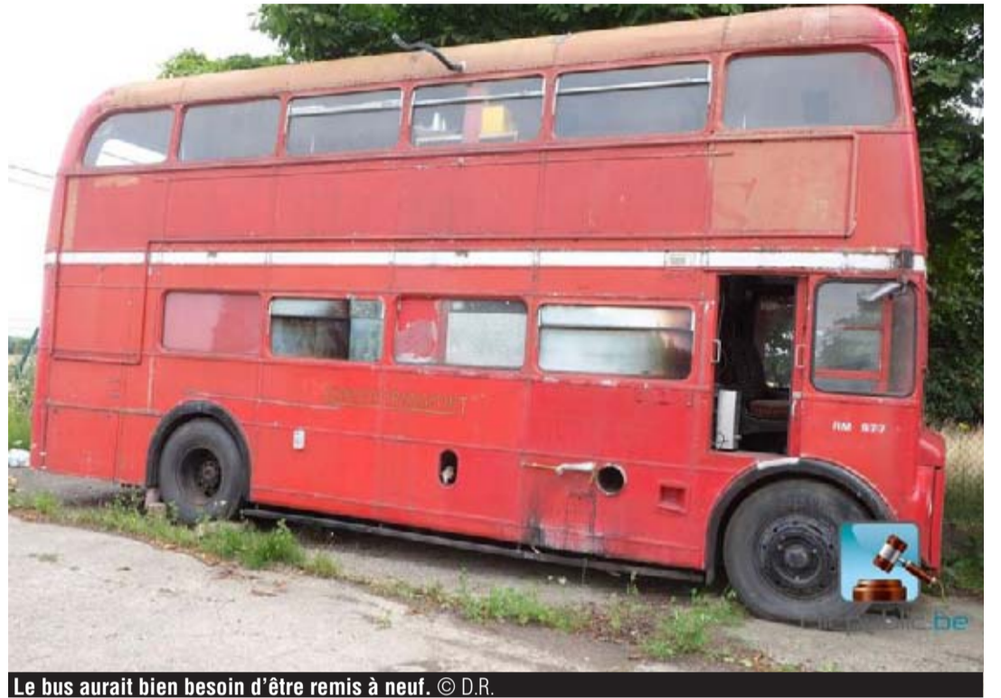
Le bus aurait bien besoin d'être remis à neuf.

nesse dans les semaines ou mois à venir, à moins que l'acheteur ne soit un simple collectionneur de véhicules de transports. L'avenir nous le dira... THIBAUT VAN HOOF