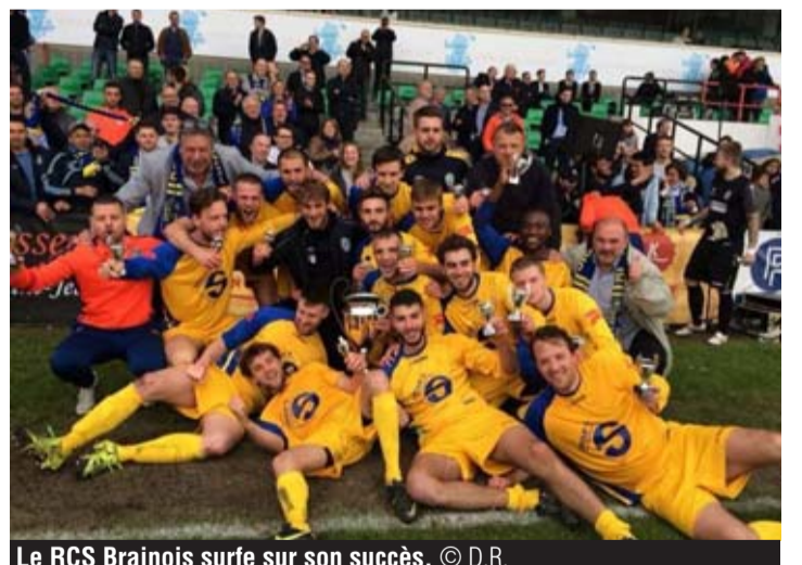
Le RCS Brainois surfe sur son succès.

C'est un beau geste que propose le RCS Brainois. Pour fêter les 105 années d'existence du club et surtout la montée du club à l'échelon national, 20 ans après l'avoir quitté, le club de football phare de la commune invite tous les Brainois à venir voir les matches à domicile gratuitement et ce durant toute la saison 2018-2019. Les habitants d'Ophain-Bois-Seigneur-Isaac et Lillois ne sont évidemment pas oubliés dans ce package de bienvenue. Le club précise toutefois que l'entrée sera payante pour « les