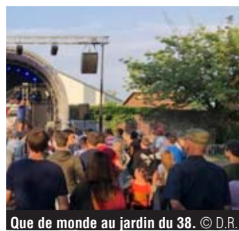
Que de monde au jardin du 38.

SWING, Sonnfjord, DJ Sonar, l'ancien DJ de Starflam, ou encore le DJ Laurent VCG. En plus de cette line-up 100% de chez nous, les produits locaux ont été mis à l'honneur avec notamment des foodtrucks à l'accent local comme le Bistrone, le food truck de burgers dont le propriétaire est originaire de Bousval, la bière de Villers et tout un tas d'autres produits de chez nous. •