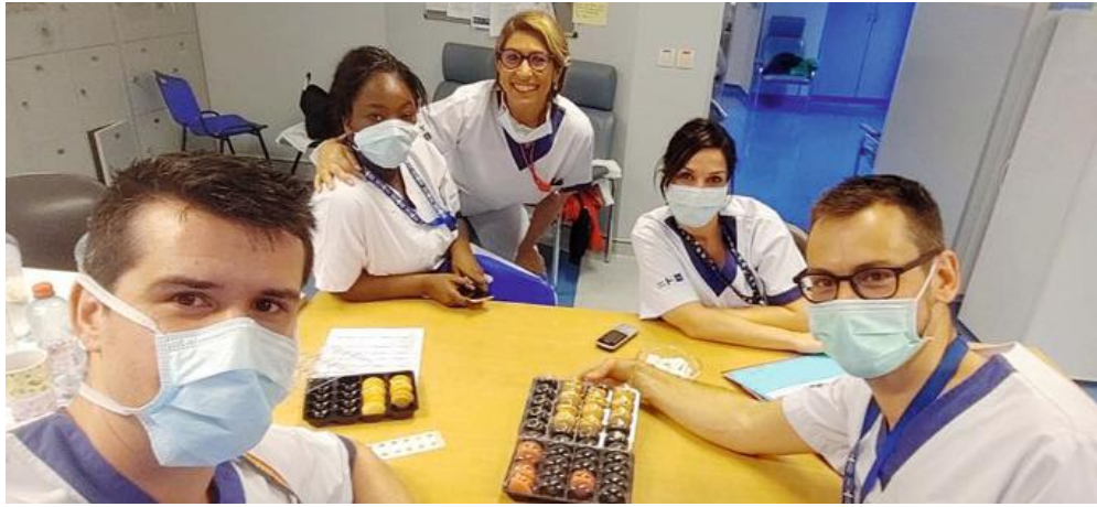
Les macarons ont été distribués dans douze hôpitaux et quatorze services.